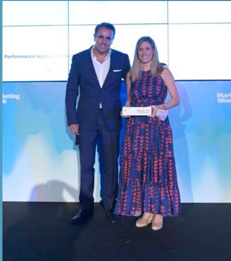
Performance Agency of the Year - Ogilvy