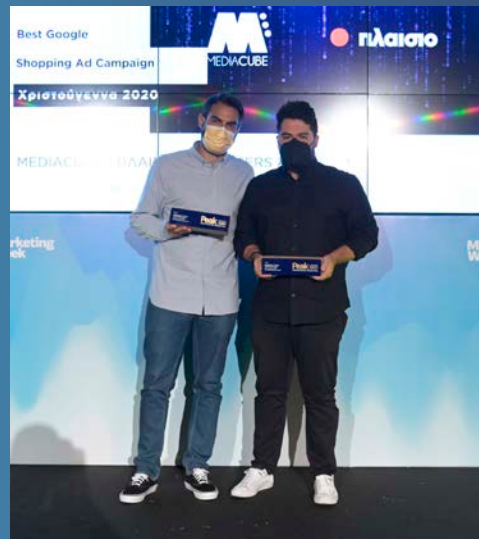
Best Google Shopping Ad Campaign - Mediacube