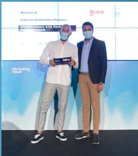
Best Use of Video for Performance Purposes - Omniciq