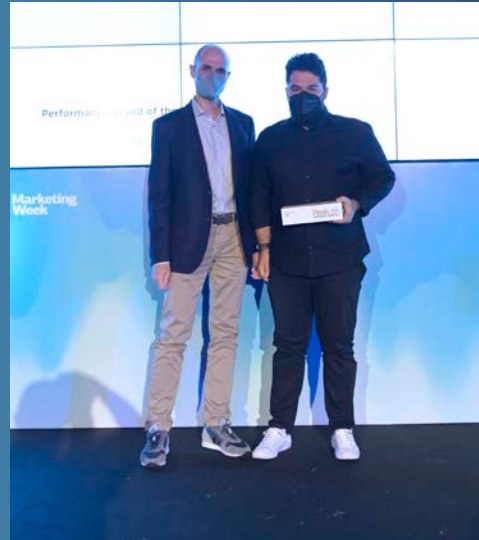
Performance Brand of the Year - Πλαίσιο Computers AEBE